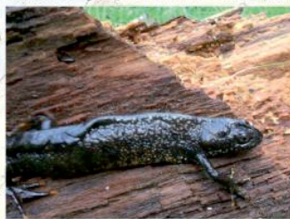
Čolek velký ( Triturus cristatus )

Až na konci roku 2012 vznikla idea projektu rekonstrukce lokality. Jejím hlavním cílem je chránit Čolka velkého, ale i další obojživelníky, a tím podpořit biodiverzitu. Přínosem projektu je též péče o místní krajinu (a její zkrášlení), stejně jako zvýšení informovanosti širší veřejnosti o přírodních hodnotách Chotěbořska. Důležitou součástí projektu je biomonitoring, na jehož základě se stanovují další úpravy lokality.