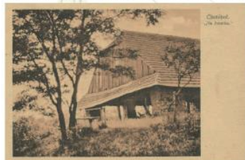
Městská cihelna, okolo roku 1869.

Přítomnost tůní a terénních nerovností v této oblasti se může zdát jako přírodní rarita, jde však o lidské dílo. Již okolo roku 1869 zde stála jedna z městských cihel. V obytné budově žila rodina cihlářského topiče Vltavského. Velká část dnes již zcela zaplavených prohlubní byla původně hliníkem cihelny. Jelikož se na počátku 20. století začaly v okolí Chotěboře zakládat soukromé cihelny, nezbylo městu nic jiného, než tu místní obecni zrušit. Další terénní nerovnosti vznikly ve 30. letech 20. století během stavby náspu železniční vlečky do muničního skladu na Bílku.