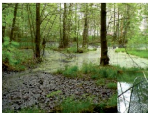
Pohled na velkou tůň od jihu a Živolovná past s odchycenými Čolky velkými.

Realizace projektu byla od srpna 2013 do března 2014. Následná činnost bude zaměřena na údržbu prostoru a další úpravy, jako je například příprava informačních tabulí a dřevěného chodníku směrem k tůním.